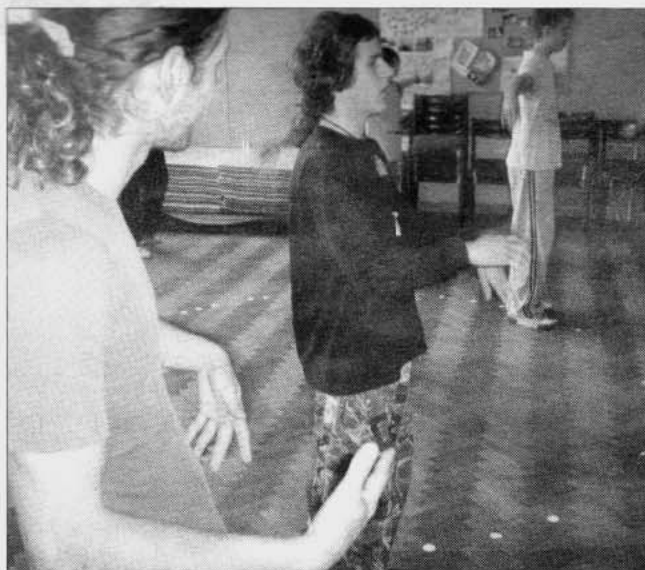
Účastníci dielni sa presvedčili, že pantomima, je hlavne pohyb.